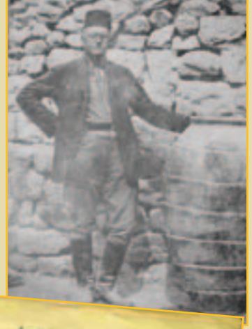
Bedrich Hrozny Kültepe'de kazı çalışmalarında

"Ezza" sözünü Hrozny, İngilizce'deki "to eat" ve Almanca "essen" (yemek) fiilleriyle karşılaştırdı. Cümlenin ikinci kısmındaki "watarra"nın temel aldığı "watar" sözünü de Hrozny, İngilizce "water", Almanca "wasser" sözcükleriyle karşılaştırdı ve Hititçede içmek anlamına gelen "eku" fiilini Latince su anlamına gelen "aqua" sözcüğüyle karşılaştırdı. Böylece Hititçe cümleler ilk kez anlamlı bir biçimde çevrilmiş oldu. Hrozny'nin bu buluşları bütün dünyada, bilim çevrelerinde önemli yankılar buldu.