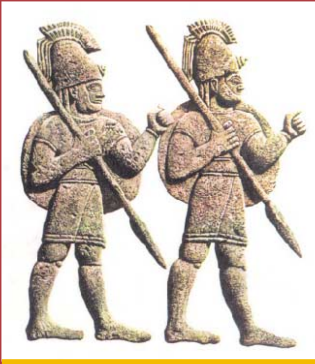
Hititler güçlü orduları yardımıyla Anadolu'da bulunan küçük krallıkları birleştirmiş, ülkede birlik sağlamışlardı.

Hint-Avrupa kökenli olan Hititler din, mitoloji, töre ve örf yönünden büyük ölçüde Hatti etkisinde kalmışlardır. Hitit dinindeki tanrıların çoğu Hatti dininden alınmıştı. Hititlerde birer kral adı olan Tuthaliya, Arnuvanda ve Amunna, Hatti dilinde kullanılan dağ adlarıydı. Hattiler Anadolu'nun yerli halkıydı ve MÖ 3. binin ortalarından beri küçük krallıklar, beylikler halinde yönetiliyorlardı. Her biri bir tür kent devleti olan bu beylikler, MÖ 2000'li yıllarda teker teker Hititlerin eline geçti. Bununla birlikte nüfusun çoğunluğunu hâlâ Hattiler oluşturuyordu. Hititler yerlilerle uzlaşmacı bir tutum içinde olduklarından hem kentlerin eski adlarını olduğu gibi kullandılar, hem de kendilerine Hatti ve Hurri adları aldılar. Bu nedenle o dönemdeki prensliklerin hangilerinin Hitit, hangilerinin Hatti ya da Hurri olduğunu anlamak oldukça güçtür.