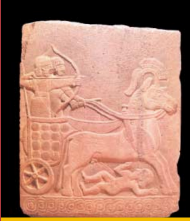
Hitit ordusunun belkemiğini savaş arabaları oluştururdu. Bu tablette Hitit savaş arabasının düşman karşısında kazandığı bir başarı resmedilmiştir.

Yirminci yüzyılın başlarında Ankara'nın 150 km doğusunda bulunan Boğazköy'de kazılar yapılmış ve Hitit uygarlığına ait 30 000'in üzerinde çivi yazılı tablet gün ışığına çıkarılmıştı. Boğazköy, Hititlerin başkenti Hattuşaş'ın bulunduğu yerd. Burada bulunan kil tabletler üzerine yazılmış çivi yazılarının büyük önemi vardı. Bu tabletler Hitit tarihi ve uygarlığı hakkında çok şey söyleyecekti.