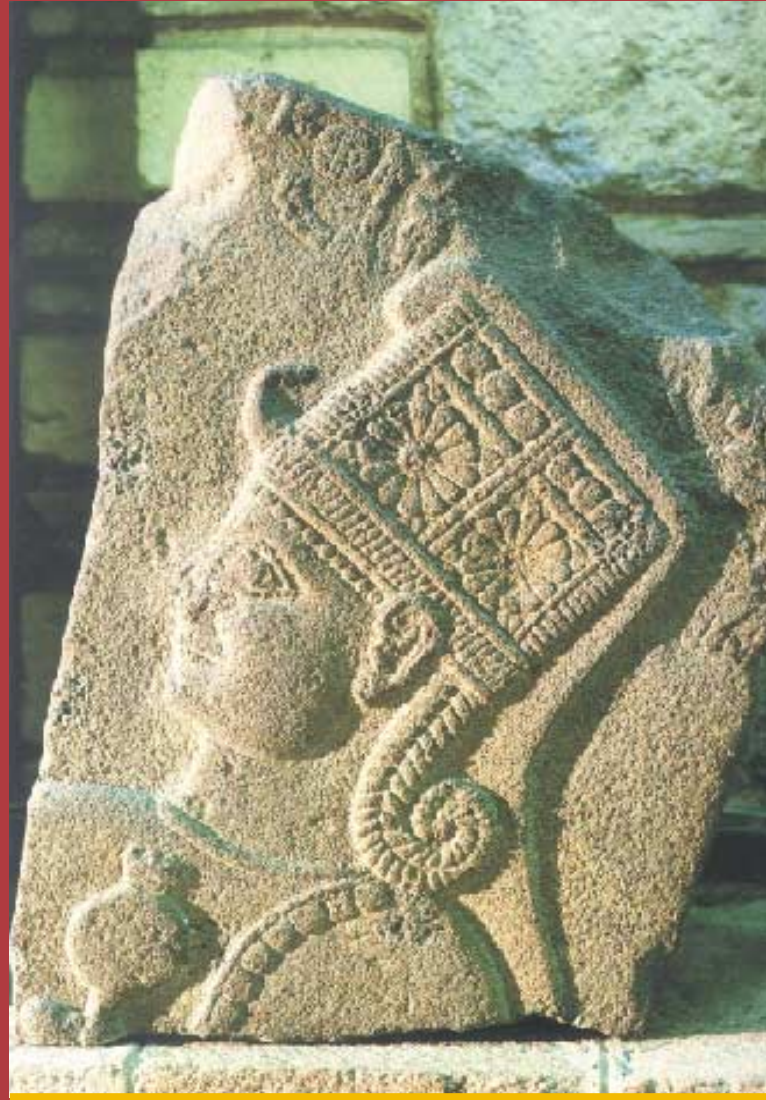
Anadolu Medeniyetleri Müzesinde sergilenen bu figür, Geç Hitit dönemine aittir.

Hititler Anadolu'ya ilk geldiklerinde burada kendilerine Hatti denilen bir kavimle karşılaşmışlardı. Bugün Alacahöyük, Horoztepe gibi yerlerde bulunan eserleri yapan bu yerli kavim, o dönemde yüksek bir uygarlık düzeyine ulaşmıştı. MÖ 2000'lerde Anadolu'ya gelen Hint-Avrupa kökenli Hititler de yurtlarından Hatti ülkesi diye söz etmeyi sürdürdüklerinden, Boğazköy'de bulunan tabletleri ilk okuyan filologlar bambaşka bir dil konuşan, farklı bir kavim oldukları halde Hint-Avrupa kökenli Hititleri Hatti olarak adlandırmışlardı. Oysa Anadolu'ya sonradan gelen bu kavim kendilerini daha önceleri Nasice konuşan, Nasililer olarak adlandırıyorlardı. Ancak Anadolu'da karşılaştıkları Hattileri yenip, yönetimi ele geçirmelerine karşın, onların kültür potasında eriyen Nasililerin de Hititler olarak adlandırılması sürüp gitti.