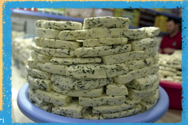
Van otlu peyniri