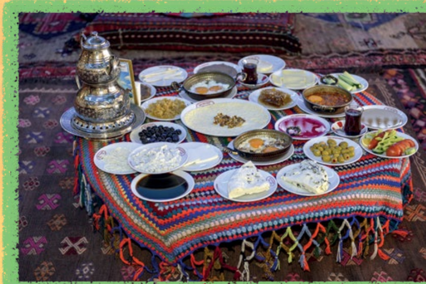
Yöresel Van kahvaltısı

Van, kahvaltılarıyla olduğu kadar yöresel yemekleriyle de ünlü. Hayvancılığın yaygın olması nedeniyle tereyağı, yoğurt ve özellikle dağlardan toplanan otlarla yapılan Van otlu peyniri, Van kahvaltılarının vazgeçilmezleri. İnci kefaliyle yapılan balık bostaniye, tandır balığı, tuzlu balık gibi pek çok yemek de bu kente özel. İlbaharda dağlardan toplanan çiriş adındaki bir bitki ve yumurtayla yapılan çiriş mihlası; kavrulmuş ve dövülmüş buğdayın dut kuruşu, elma kuruşu gibi yemişlerle karıştırılmasıyla yapılan bir tür tatlı olan kavut; yeşil mercimek ve etle yapılan bir yemek olan sengeser lezzetli yöresel yemeklerin yalnızca birkaçı.