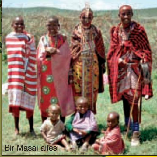
Bir Masai ailesi