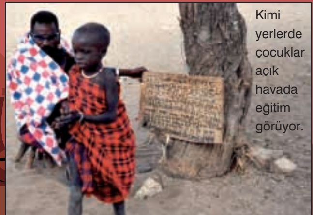
Kimi yerlerde çocuklar açık havada eğitim görüyor.

Afrika’nın birçok yerinde çocuklar, zamanlarını büyüyene kadar anneleriyle birlikte geçirirler. Büyük çocuklar, küçük kardeşlerine de bakarlara. Erkek çocuklarsa ergenlik dönemine girdikten sonra babaları ya da ailenin diğer erkekleriyle beraber tarlaya ya da ava gitmeye başlarlar.