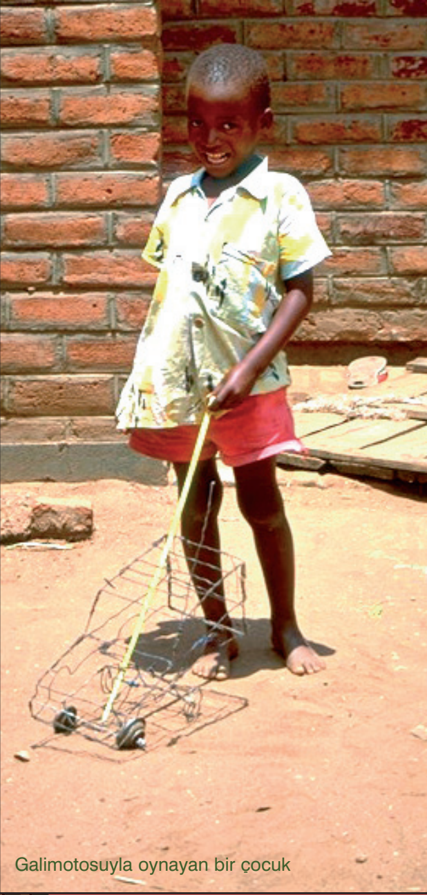
Galimotosuyla oynayan bir çocuk