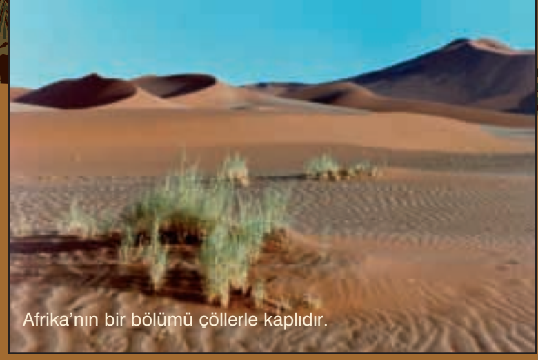
Afrika'nın bir bölümü çöllerle kaplıdır.

Uçsuz bucaksız savanlar, çöller ve tropikal yağmur ormanları... Yüksek dağlar, düzlükler, çağlayanlar, ırmaklar.... Birbirinden ilginç hayvanlar, bitkiler... Eşsiz bir doğa! Eşsiz bir çeşitlilik! İşte Afrika! Dünyanın en büyük ikinci kıtası. Türkiye'nin yaklaşık 40 katı büyüklükte. Afrika'da 50 kadar