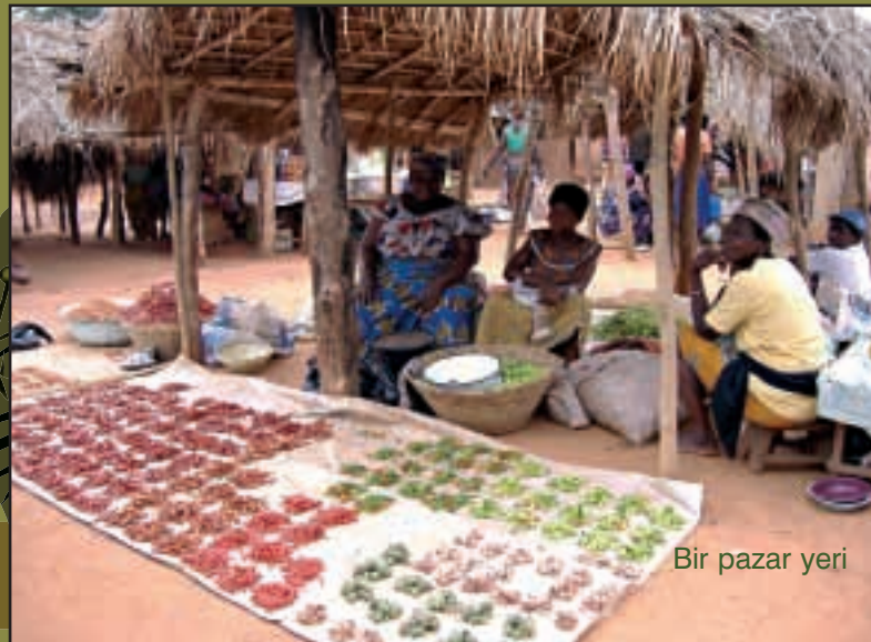
Bir pazar yeri

Afrika'da su kimi bölgelerde bol, kimi bölgelerde de çok az. Suyun az olduğu bölgelerde yaşayanlar için su taşımak günlük yaşamın ayrılmaz bir parçası.