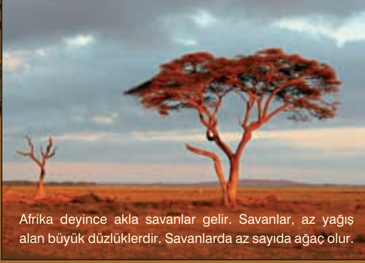
Afrika deyince akla savanlar gelir. Savanlar, az yağış alan büyük düzlüklerdir. Savanlarda az sayıda ağaç olur.