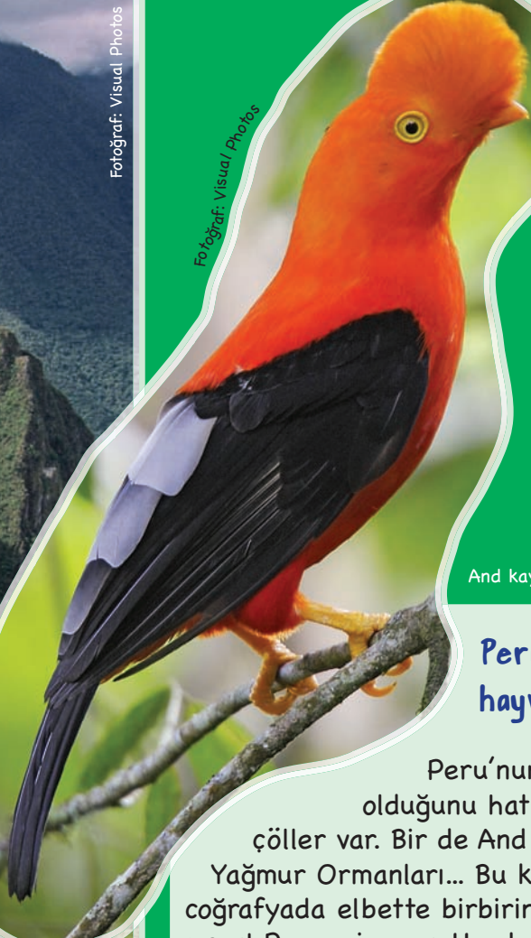
And kaya kuşu