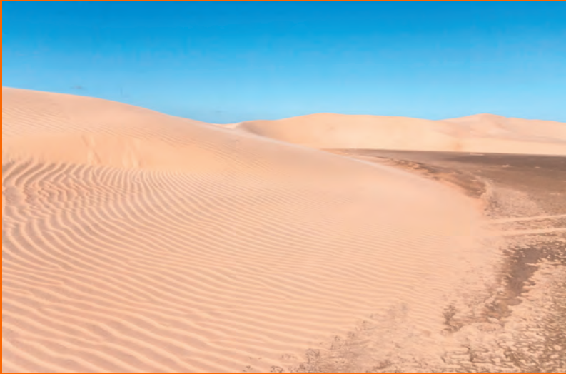
Madagaskar'dan bir çöl görüntüsü

Ülke genelindeyse sıcak ve yağışlı, serin ve kurak olmak üzere iki mevsim var. Bu iklim çeşitliliği ülkedeki bitki örtüsünü ve hayvan çeşitliliğini etkiliyor. Örneğin ülkenin doğu kıyılarında yağmur ormanları yoğunluktayken, güneyinde çöller bulunuyor.