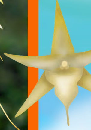
Kuyruklu yıldız orkidesi