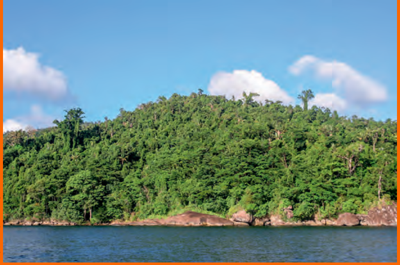
Madagaskar'da bulunan Masoala Yağmur Ormanı'ndan bir görüntü

Madagaskar'ın iklimi bölgesel deęişiklikler gösteriyor. Ülkenin doğu kıyılarında tropik, güneyinde kurak iklim yaşıyor. İç kesimlerinde yüksek dağların bulunması nedeniyle buralarda kıyılara göre daha soğuk ve daha kuru bir iklim görülüyor.