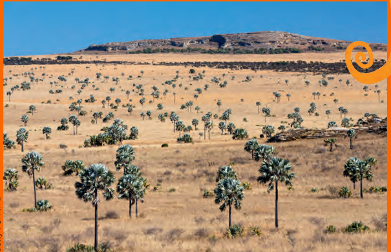
Madagaskar'dan bir savan görüntüsü

Madagaskar'da çöllerle yağmur ormanları arasında genellikle savanlar bulunuyor. Savanlarda kuraklığa dayanıklı çeşitli ağaçlar, otlar ve kaktüsler var.