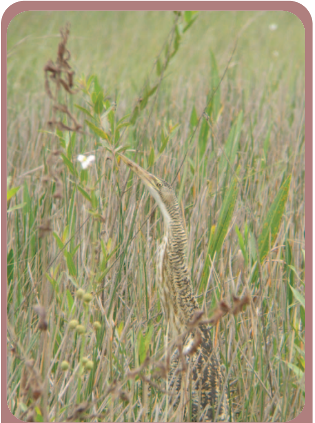
Balaban, Türkiye'de de yaşıyor. Ancak fotoğrafta gördüğümüz Amerika balabanı. Bu tür, çayırların içinde yaşıyor. Onu, çayırların arasından ayırt etmek zor. Hatta rüzgâr, çayırları hareket ettirdikçe o da hareket ediyor. Böylelikle fark edilmesi daha da zorlaşıyor.