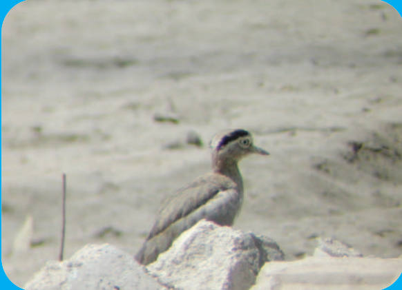
Uzmanımız, tüm And ülkelerini, Ekvador dışında Venezuela, Kolombiya, Peru, Bolivya ve Şili'yi gezmiş. Koca gözü olarak adlandırılan fotoğraftaki kuş türünü Peru'da görmüş.

çıptıklarından, onların fotoğraflarını çekmenin çok zor olduğunu da ekliyor. Anlaşılan Ekvador'da yaşam, kimi zaman sinekkuşları gibi hızlı, kimi zaman trogonları gibi yavaş. Trogonlar, ormanlarda yaşayan ve kocaman gözü olan kuşlar. Boyla'nın anlattığına göre, bu kuşlar bir dala