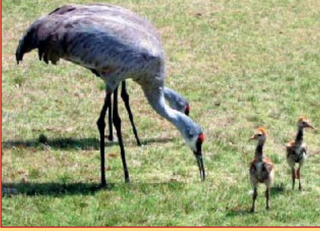
Bu turna yavrularının böyle sakin göründüklerine bakmayın. Onlar, dal parçalarıyla "istop" oynamaya bayılırlar.

Hayvan yavruları birbirleriyle oynarken eğlenir ve bu da bize sevimli gelir. Er ya da geç bu oyunların hepsi onlar için bir öğrenme sürecine dönüşür. Yavruların oynayarak öğrenmelerinin süresi hayvanların türlerine göre değişir. Örneğin, ayı yavruları üç yıl, fil yavrularıyla dört yıl süreyle oyunla öğrenmeye devam ederler. Oyunlar sayesinde nasıl avlanacaklarını ya da kendilerini nasıl koruyabileceklerini öğrenirler.