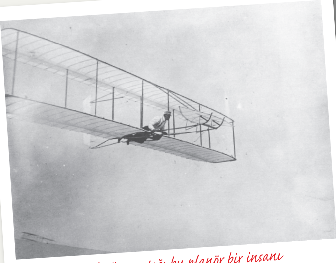
Wright Kardeşler'in yaptığı bu planör bir insanı taşıyabiliyordu ama havada çok kısa bir süre kalabiliyordu!