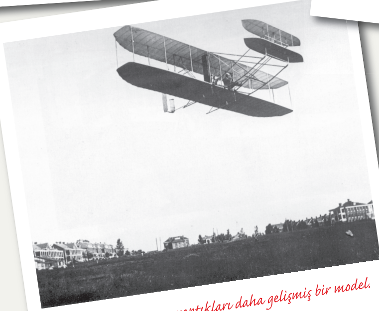
Bu da, birkaç yıl sonra yaptıkları daha gelişmiş bir model. Pilotun ters oturduğunu fark ettiniz mi?

yüzeylerinin farklı rüzgâr koşullarına nasıl tepki verdiğini gözlemliyorlardı.