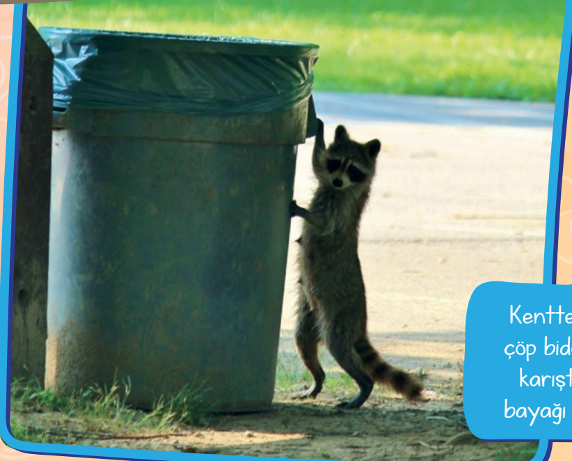
Kentteki bir çöp bidonunu karıştıran bayağı rakun

Bayağı rakunların doğal yaşam ortamı Kuzey Amerika kıtasının güney kesimlerinden Güney Amerika'nın iç kesimlerine kadar olan bölgedir. Çoğunlukla ormanlarda ve akarsu kıyılarında yaşayan bu rakun türü kentlerde de sıklıkla görülür.