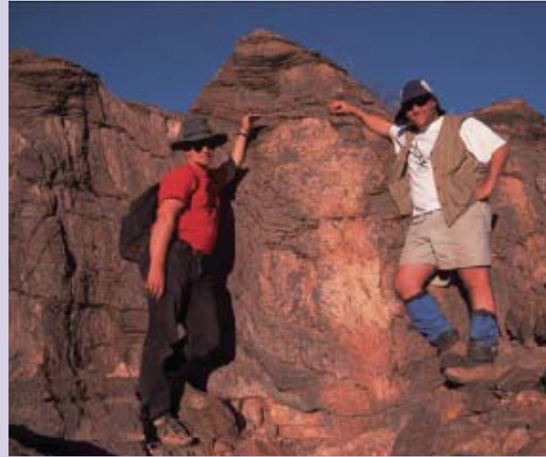
Araştırmacılar, suda çözünen karbondioksitin, başka kimyasal maddelerle birlikte çökmesiyle oluşmuş karbonatlı kayaç oluşumlarını gösteriyorlar.

1998 yılında Hoffman ve Schrag, Kartopu Dünya kuramının doğruluğunu gösteren verilerini bilimsel bir makaleyle tüm dünyaya duyurdular.