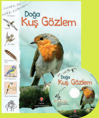
Doğa - Kuş Gözlem, TÜBİTAK Popüler Bilim Yayınları