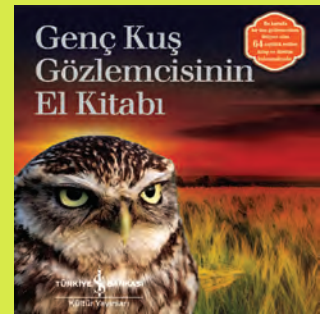
Genç Kuş Gözlemcisinin El Kitabı, İş Bankası Kültür Yayınları