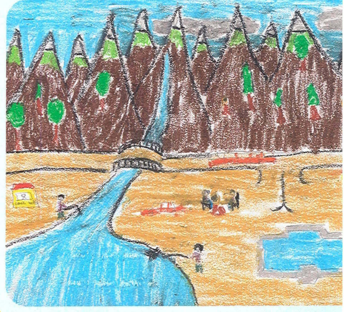
Kemal Öner Ergazi İÖÖ 5. sınıf