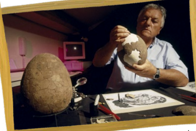
Fosilleşmiş dinozor yumurtaları üzerinde inceleme yapan bir fosilbilimci