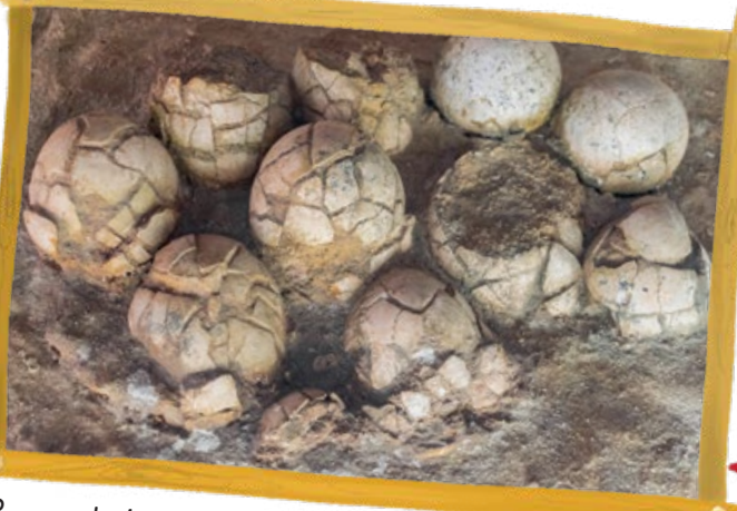
Rusya'da bulunan fosilleşmiş dinozor yumurtaları

Dinozorların hepsi yumurtayla çoğalırdı. Genellikle otçul dinozor yumurtaları bir basketbol topu kadar büyüktü. Etçillerinkiyse daha küçük ve ovaldi. Büyük dinozorlar yumurtalarını derin bir alana gömüp üzerlerini de yaprak ve toprak gibi malzemelerle kapatırdı. Yumurtadan çıkan yavrular hızla büyürdü.