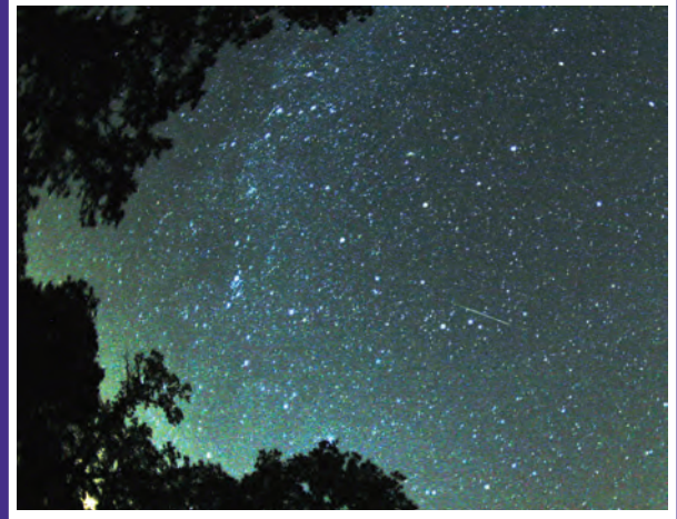
Bu fotoğrafta beyaz bir çizgi şeklinde gördüğünüz şey bir akanyıldız.

Birkaç aydır gece gökyüzünde yer alan Satürn ve Mars, Ağustos'tan sonra artık görülmeyecek. Hava karardıktan sonra batıya doğru bakarsanız ufkun üzerinde sarımsı renkte parlayan Satürn ve Mars'ı görebilirsiniz. Gün geçtikçe Satürn ve Mars'ın birbirine yaklaştığını göreceksiniz. Ağustos ortasında iki gezegen birbirine çok yakın konuma gelecek. Bu sırada gökyüzünün parlak yıldızlarından biri olan Spika da onların çok yakınında, hemen altlarında olacak. Beyaz rengi sayesinde Spika'yı Mars ve Satürn'den kolayca ayırabilirsiniz.