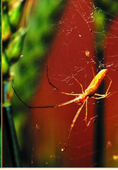
Tarım zararlılarıyla savaşımında, bu örümcek türü gibi avcı hayvanlardan yararlanılabiliyor.

Karantina Tüzüğü kapsamında, iç ve dış karantina yöntemleri belirleniyor. Amaç, yurtdışından ya da yurtiçinde bölgeler arasında zararlı bulaşmalarının önüne geçebilmek.