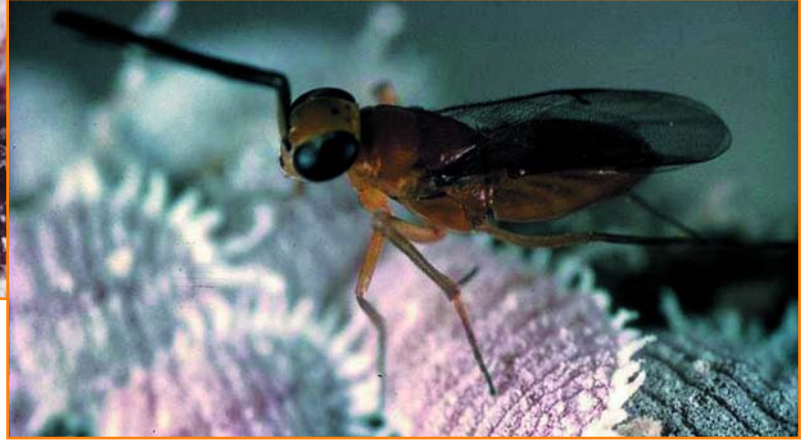
Ülkemizde biyolojik savaşında kullanılan iki böcek türü var. Önemli bir turuncu zararlı olan unlu bite (beyaz renkte görünenler) karşı, 1965'ten beri, Akdeniz Bölgesi'ndeki üreticiler tarafından kullanılıyor.

serasındaki yaprak sayısını yaklaşık olarak hesaplayıp, yaprak başına bir Phytoseiulus persimilis gelecek şekilde bu canlıları bitkilerin üstüne salmak. Bundan sonrası, bu akarlar kalıyor.