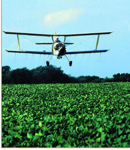
Zararlılarla savaşımında, havadan ilaçlama da yapılıyor. Ayrıca kimyasal ilaçlar, toz, yağlar, tablet ve macunlar, tanecikler, gübre karışımları gibi farklı biçimlerde kullanıma sunuluyorlar.

Entegre savaşım, "Entegre Zararlı Yönetimi" (IPM) olarak da adlandırılıyor. Bu savaşımında en büyük rolü, kültürel önlemler, biyolojik savaşım, biyoteknik yöntemler ve kimyasal savaşım oynuyor. Günümüzde üreticilere önerilen en geçerli yöntem bu. Çünkü bu savaşım tipinde, farklı yöntemleri, birbirinin etkisini bozmadan uyumlu bir biçimde uzun süre uygulayabilmek olası. Bu da, zararlıların sayılarını artıran etkenler ve bu türlerin çevreyle ilişkilerini saptayarak, yani kültürel önlemler alınarak gerçekleştiriliyor. Entegre savaşımında, zararlıların sayılarını ekonomik zarar vermeyecek düzeyde tutabilmek; bitkisel üretimin artırılması; nitelikli ve ilaç kalıntıları içermeyen ürün elde edilmesi; doğal düşmanların korunması ve desteklenmesi; tarla, bahçe ve bağların belirli aralıklarla kontrol edilmesi; çiftçilerin kendi tarlası, bahçesi ve bağının uzmanı haline getirilmesi; ilaçların toprak, su ve havaya bulaşmasının önlenmesi amaçlanıyor.