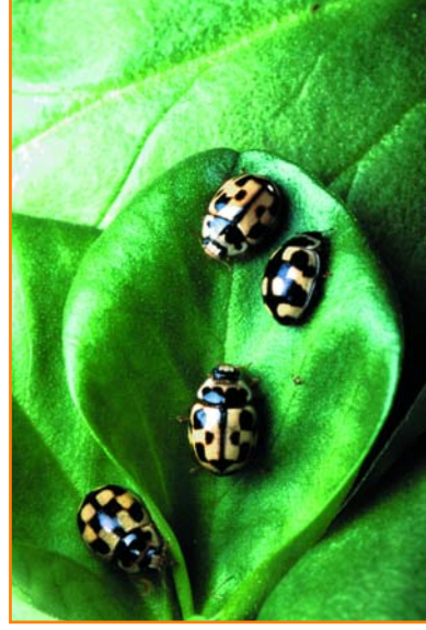
Bu uğurböcekleri, bakla bitkisinin yapraklarında, yiyecek için yaprakbiti arıyorlar.

Zirai Karantina Kanunu ve Tarım Bakanlığı'nca hazırlanan Zirai Karantina Tüzük ve Yönetmeliği'yle uygulanıyor. Örneğin, Zirai