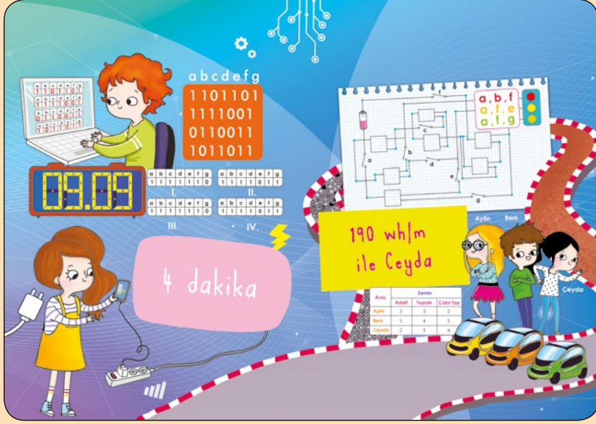
23 Nisan Kutlama Kartı'nın Yapılışı