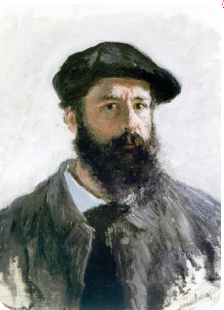
Ressamlar ve Otoportreleri Claude Monet (1840–1926)