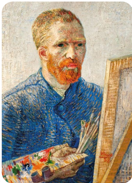
Ressamlar ve Otoportreleri Vincent van Gogh (1853–1890)