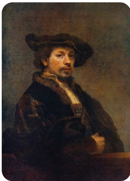
Ressamlar ve Otoportreleri Rembrandt van Rijn (1606–1669)