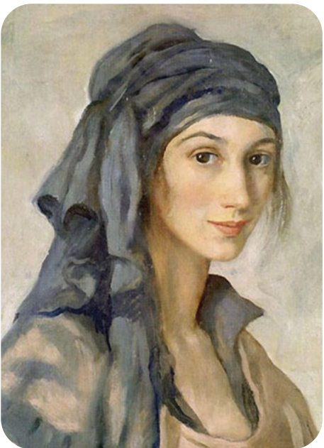
Ressamlar ve Otoportreleri Zinaida Serebriakova (1884–1967)