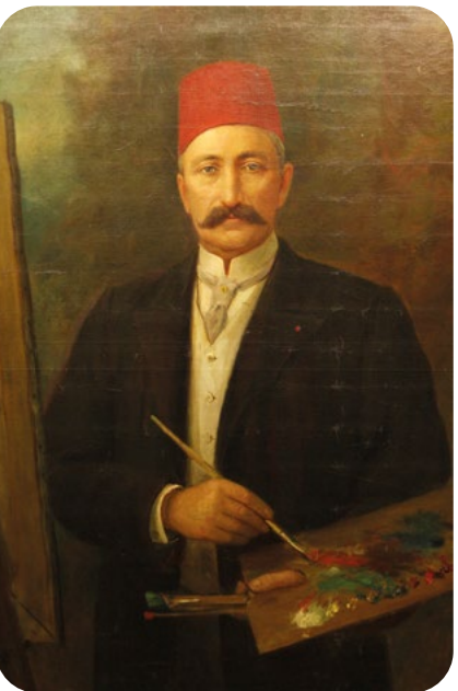
Ressamlar ve Otoportreleri Şeker Ahmet Paşa (1841–1907)