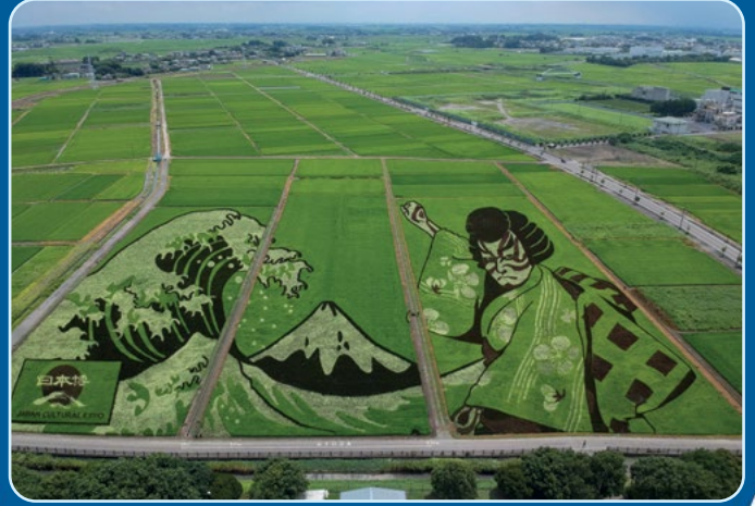
Guinness Dünya Rekorları'nda yer alan Saitama bölgesindeki eser

Japonlar, sofralarından eksik olmayan pirincin hasat zamanını kutlamak için çeşitli festivaller düzenler. Bunlardan biri de farklı renklerde pirinçlerin yetiştirilmesiyle oluşturulan dev tarla resimlerinin sergilendiği Gyoda Pirinç Tarlası Sanatı Festivali'dir. Gyoda'daki bu eserler, pirinçler hasat edilene kadar üç ay boyunca ziyaret edilebiliyor.