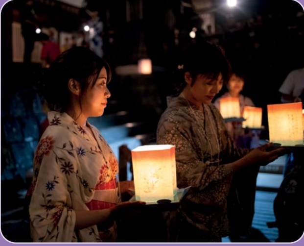
Obon Festivali'nde gökyüzüne bırakılan fenerler

Yazın düzenlenen Obon Festivali, Japonların atalarına saygılarını gösterdikleri bir festiveldir. İnsanlar geleneksel kıyafetlerini giyer, rengârenk fenerleri gökyüzüne bırakır ve onları bugünlere getiren atalarını anar.