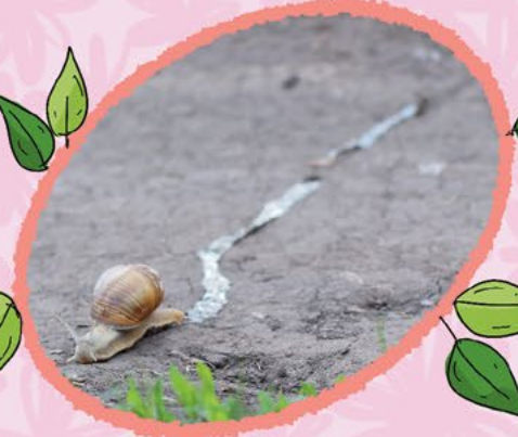
Salgıladığı mukusun izini arkasında bırakarak ilerleyen bir bahçe salyangozu

Başında iki çift dokunaç bulunur ve bu dokunaçlardan uzun olan çiftin ucunda göz benzeri yapılar vardır. Koku almak içinse kısa olan diğer iki dokunacını kullanır. Bitkilerin yaprak ve meyveleriyle beslenen bahçe salyangozu, kabuğunun içine çekilip özel bir salgı salgılayarak tehlikelerden korunmaya çalışır.