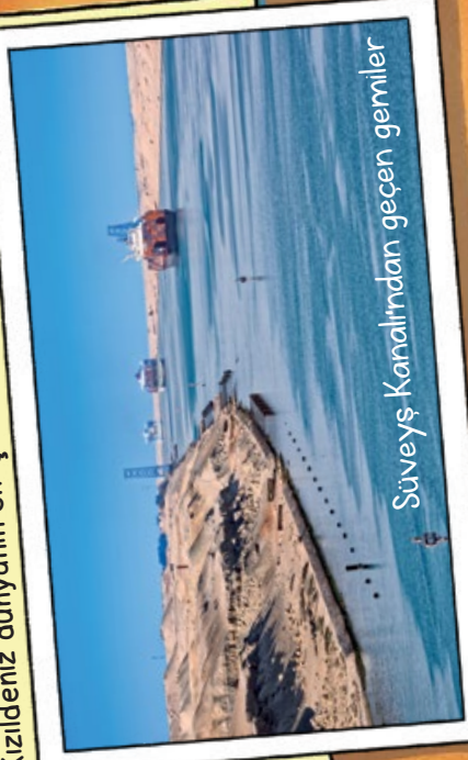
Süveyş Kanalı'ndan geçen gemiler

Kızıldeniz kuzeyde iki kola ayrılır. Soldaki kolda bulunan Süveyş Kanalı aslında 157 yıl önce açılmış bir yapay su yoludur ve Kızıldeniz'i Akdeniz'e bağlar. Kanal sayesinde gemiler Afrika'nın etrafını dolaşmadan Hint Okyanusu'ndan Akdeniz'e ulaşabilir. Bu nedenle Kızıldeniz dünyanın en işlek deniz yollarından biridir.